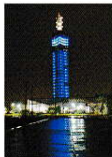
「道の駅あさひ田 पोर्टタワー・サリオン」 (秋田県)

特別協賛： 協賛企業：アストレーザカ株式会社、サノフィ株式会社、アステラス製薬株式会社、LifeScan Japan株式会社、株式会社三和化学研究所、ノボルディスクファーマ株式会社、協和発酵キリン株式会社、興和製薬株式会社、日本イーライリリー株式会社、日本ペーリンガーインゲルハイム株式会社、日本ベクトン・ティッキンソン株式会社、アーケレイ株式会社、キッセイ薬品工業株式会社、テルモ株式会社、株式会社茂田田、積水メディカル株式会社、サライ株式会社、株式会社スキャン、ニプロ株式会社、富士フィルムファーマ株式会社、ロシニCジャパン株式会社、アボットジャパン株式会社、サンスター株式会社、日本メドトロニック株式会社、ティーベック株式会社、味の素株式会社、PNC株式会社（旧パナソニックヘルスケア株式会社）、日本生命保険相互会社、日本清酒株式会社、ワイオンスクラブ国際協会